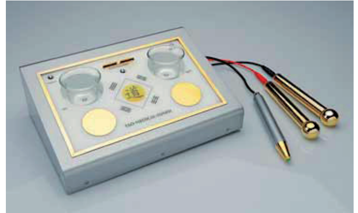
TAO Medical Tuner – Komplettsystem

Für mich ist heute die psychokybernetische Regulierung, wie sie mit dem TAO Medical Tuning 1 zur Verfügung steht, das Mittel der Wahl. Professionelle Handhabung ist einfach zu erreichen und in Verbindung mit entsprechenden Softwareprogrammen bietet sie weit mehr Möglichkeiten, als konventionelle Anwendungen der traditionellen Akupunktur. Vor allem